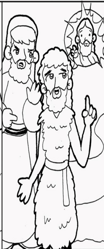
DOMINGO III Jn 1, 6-8. 19-28