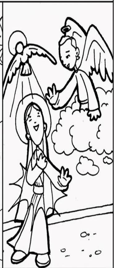
DOMINGO IV Lc 1, 26-38