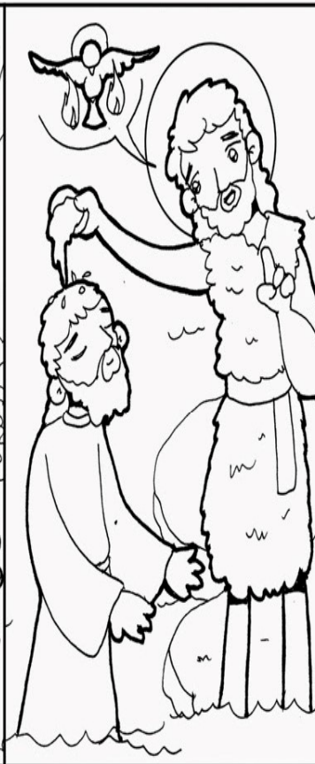
DOMINGO II Mc 1, 1-8