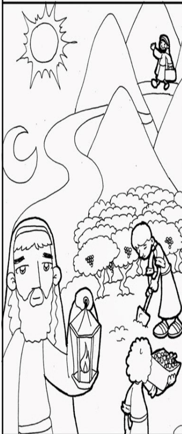
DOMINGO I Mc 13, 33-37